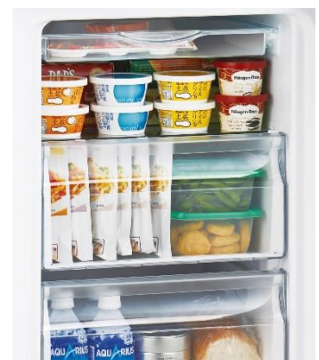
中身が見やすく整理整頓もしやすい庫内

省エネ性能に優れた本商品は、年間消費電力量 *2 193kWh/年で、電気代は年間約 5,210 円 *3 に。手に取りやすい価格帯での展開はもちろん、維持費用にもこだわること、ハイアールは今後も増加するであろう冷凍スペースへのニーズに、新たな選択肢を提供します。