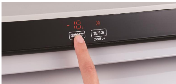
「前面タッチ式操作パネル」だから ドアを閉めたまま温度設定・急冷凍設定が可能