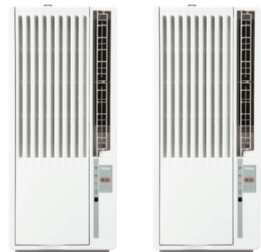
窓用ルームエアコン（JA-16W/JA-18W）

この度発売する「窓用ルームエアコン」は、工事不要で簡単に取り付け可能な、窓用冷房専用エアコンです。壁に穴を開ける必要もなく、室外機を置くスペースがなくても設置可能です。お部屋のサイズに合わせて、選べる2タイプをご用意いたしました。マイナスイオンでお部屋の空気をリフレッシュできるため、いつでも清潔に保つことができるほか、冷やしすぎを防ぐ「おやすみ運転機能」付きで、寝苦しい夜も室内の温度を適温に調整してくれるため、いつでも快適にお過ごしいただけます。