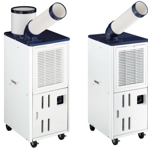
床置型スポットエアコン（JA-SPH25L/JA-SP25Y）