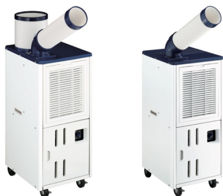
床置型スポットエアコン (JA-SPH25L/JA-SP25Y)

「床置型スポットエアコン」は、冷媒配管工事が不要なため、本体を置くスペースがあれば、どこでも使用可能です。風量調整は「強冷」「弱冷」「強風」「弱風」の4種から選べ、シーンに合わせて調節していただけます。また、ロック機能付きキャスターで移動もさせやすく、工場や作業場のほか、学校などの集会場、ゴルフ練習場や仮設建物など、幅広い場面でのニーズにお応えする商品です。さらに、JA-SPH25Lでは、最大600mmまで伸ばせる排気ダクトを装備しています。