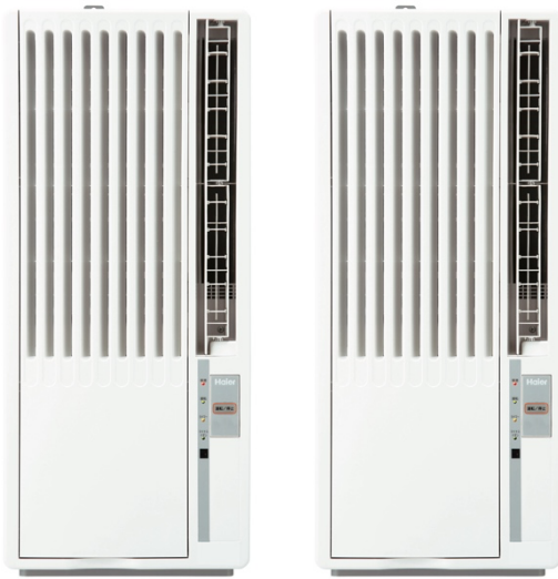
窓用ルームエアコン（JA-16W/JA-18W）

ハイアールジャパンセールズ株式会社（本社：大阪市、代表取締役社長：杜 鏡国）は、取り付け簡単な「窓用ルームエアコン（JA-16W/JA-18W）」と、移動に便利な「床置型スポットエアコン（JA-SPH25L/JA-SP25Y）」の計4機種を、全国の家電量販店、ホームセンター、GMS、WEB通販などで2022年4月1日（金）より順次発売いたします。