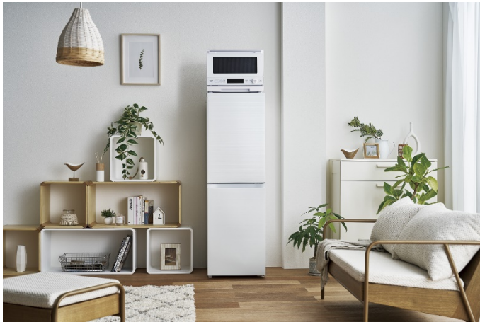
JR-SY15AR (W)設置イメージ ※単機能レンジJM-WFH20A(W)は参考商品です。