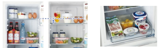
高さ調整可能トレイイメージ