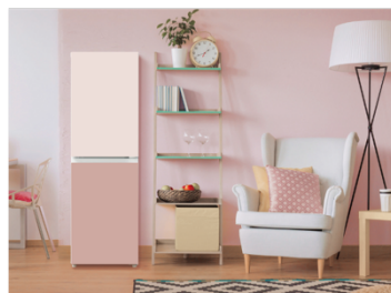
JU-RSY15MCC グレイッシュピンク