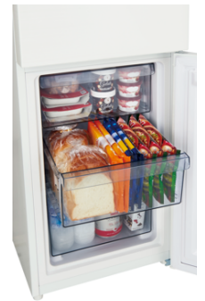
3段・引き出し式クリアバスケットイメージ

冷蔵室には2Lペットボトル3本 *3 を収納できる大容量ドアポケットを採用。一升瓶も2本収納可能 *3 です。また、重いものを載せてもたわまない「強化ガラストレイ」、保存食品のサイズに合わせて棚の位置を選べる「高さ調整可能トレイ」、出し入れしやすく、液体がこぼれても安心な「フリーケース」を採用するなど、利便性にこだわった機能が充実しています。