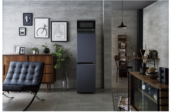
JR-SY15AR(H)設置イメージ ※オープンレンジJM-WFVH20A(K)は参考商品です。