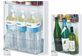
すっきりポケットイメージ