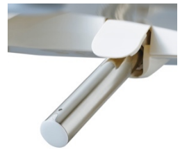
「ステンレスノズル」イメージ

ノズルには、汚れが付きづらくお手入れもしやすい「ステンレスノズル」を採用しました。また「オートノズル洗浄」機能を搭載し、ノズルの外壁・内壁を自動で洗浄し清潔を保ちます。さらに便座とノズル先端樹脂部には、菌や汚れが付きにくい抗菌加工 ※4 を施しています。