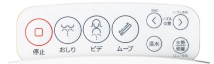
「操作パネル」イメージ