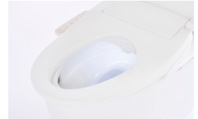
「夜間 LED 照明」イメージ

便座横の操作パネルで、ムーブ洗浄や5段階のノズル位置調整などの基本操作が簡単に行えます。また暗い室内でも安心してご使用いただける「夜間 LED 照明」やお手入れの手間を軽減する「蓋ワンタッチ着脱機構」を採用しています。カラーはアイボリー・ホワイトの2色を展開し、ご自宅のトイレ室内のイメージに合わせてお選びいただけます。