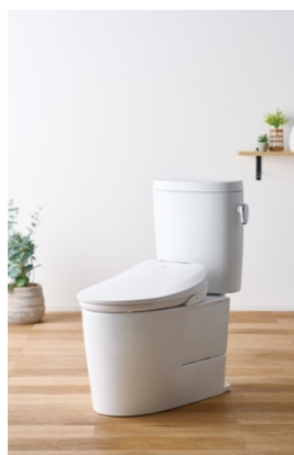
JB-SS01A (W/ホワイト) 使用イメージ