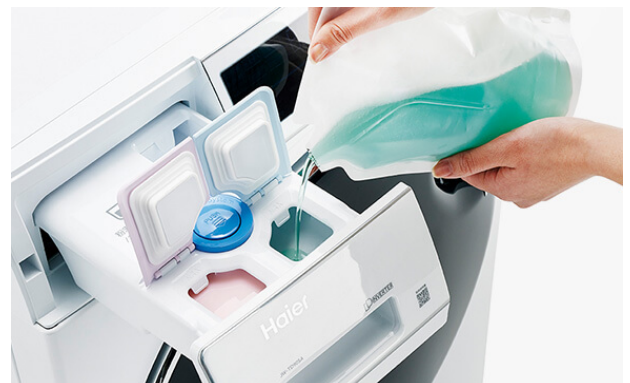
「液体洗剤・柔軟剤自動投入」機能イメージ