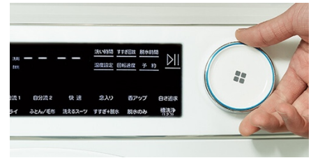
操作パネルイメージ