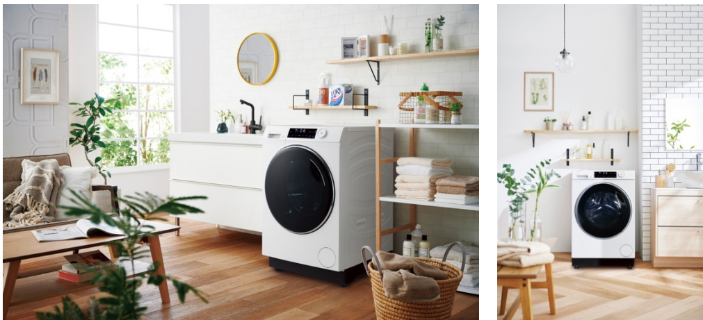
JW-TD120SA (AITO) 使用イメージ

「幅 595×奥行 700×高さ 940mm」のコンパクト設計で、限られたスペースにも設置が可能。空いたスペースに乾燥機や靴洗い機を設置するなど、空間の有効活用が可能です。また樹脂脚を設けて槽の位置を高くしているため、かがんで取り出す負担を低減できる身体にやさしい設計となっています。さまざまなスタイルの空間にフィットするシンプルかつスタイリッシュなデザインを採用し、ランドリールームを自分好みのイメージに上げることができます。