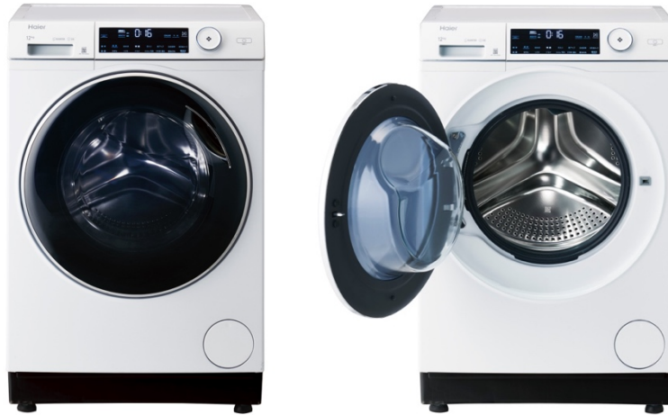
12.0kg シンプル・ドラム式洗濯機「AITO(アイト)」 JW-TD120SA (W/ホワイト)

ハイアール ジャパン セールズ株式会社（本社：大阪市、代表取締役社長：杜 鏡国）は、乾燥機能を省いたシンプルデザイン、コンパクト設計かつ大容量の12.0kg シンプル・ドラム式洗濯機「AITO(アイト)」(JW-TD120SA)を2024年4月下旬より、全国の家電量販店、ホームセンター、GMS、WEB通販などで順次発売いたします。