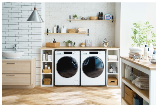
「JW-TD90SA (AITO)」・「JZ-K90A (FUWATO)」 併用イメージ

▼「FUWATO」詳細についてはこちらを御覧ください。 URL : https://www.haier.com/jp/markets/fuwato/ (HP)