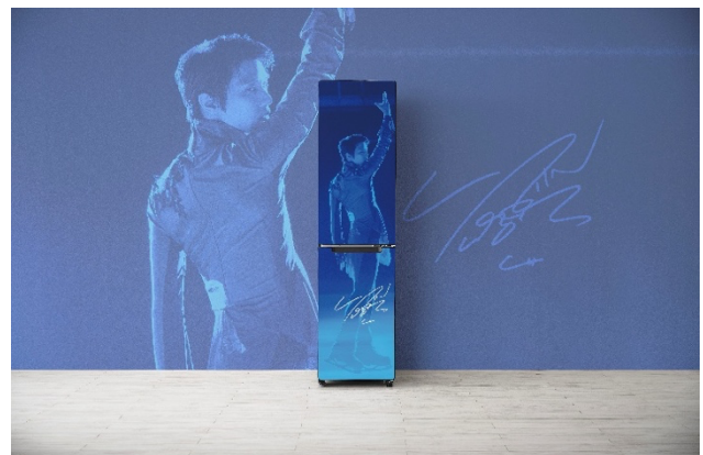
羽生結弦 ACT-2 (JU-RSX21MCV) 使用イメージ