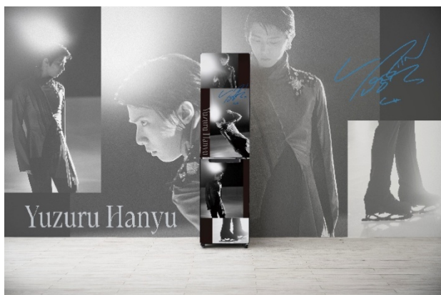
羽生結弦 ACT-1 (JU-RSX21MCU) 使用イメージ