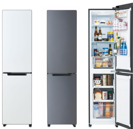
JR-SX21BR/BL (W/マットホワイト) JR-SX21BR/BL (H/メタルグレー)