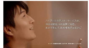
※『サービス 支え「歓び」篇』カット