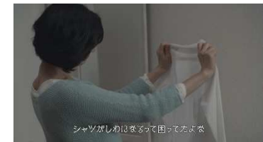
※『商品企画 支え「気付き」篇』カット