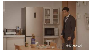
※『品質管理 支え「築く」篇』カット