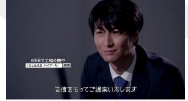
※『営業 支え「出逢い」篇』カット